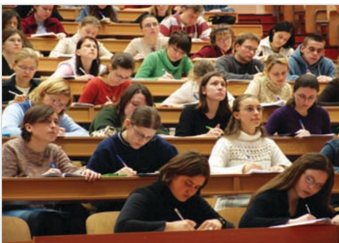
Savjet za regionalnu saradnju smatra izgradnju ljudskih resursa ključnom za sveukupan razvoj i saradnju u jugoistočnoj Evropi.

Savjet se zalaže za to da zemlje jugoistočne Evrope obrazovanje i stručnu obuku učine državnim prioritetima, da iskoriste raspoloživa sredstva iz individualnih državnih ili