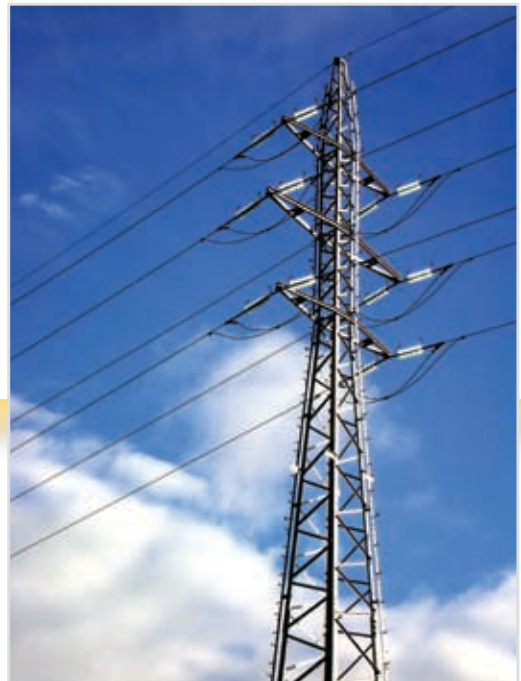
Energija i infrastruktura su preduslovi regionalnog ekonomskog razvoja i društvene stabilnosti.

Nosilac prevladavajuće teme je inicijativa Elektronska jugoistočna Evropa (eSEE) koja promoviše uvođenje informatičkih i komunikacijskih tehnologija u različite sektore struktura vlasti, poslovanja, obrazovanja i javnog života. Inicijativa je nedavno ojačana kroz osnivanje Centra za razvoj eVlade u Ljubljani – partnerstva između javnog i privatnog sektora koje će predstavljati mjesto sa kojeg se vrši koordinacija nastojanja usmjerenih ka izgradnji kapaciteta eVlada na području cijelog regiona.