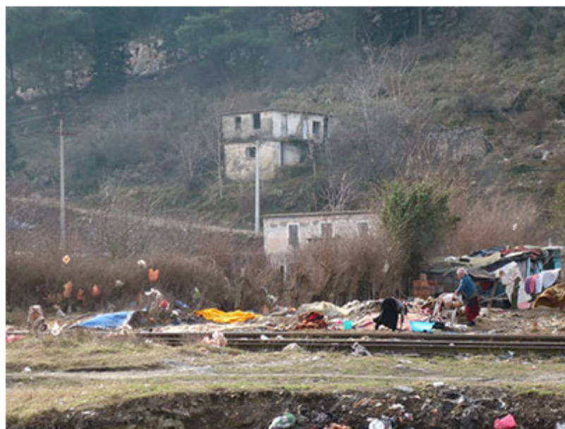
Romsko naselje pod Volujicom